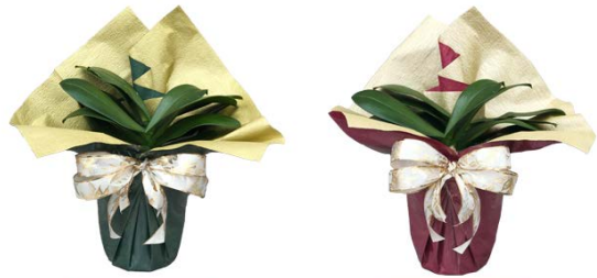
グリーン×ゴールド